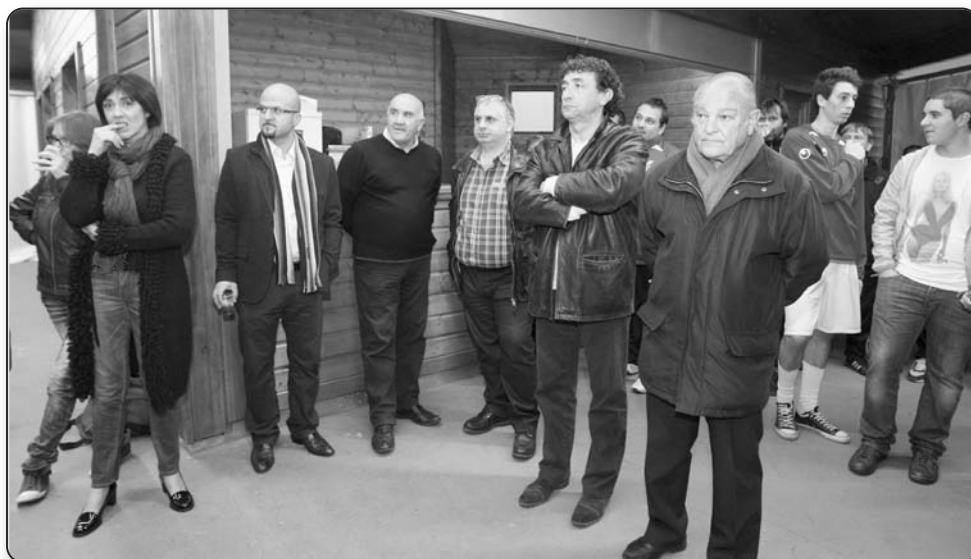
Les invités à la réception