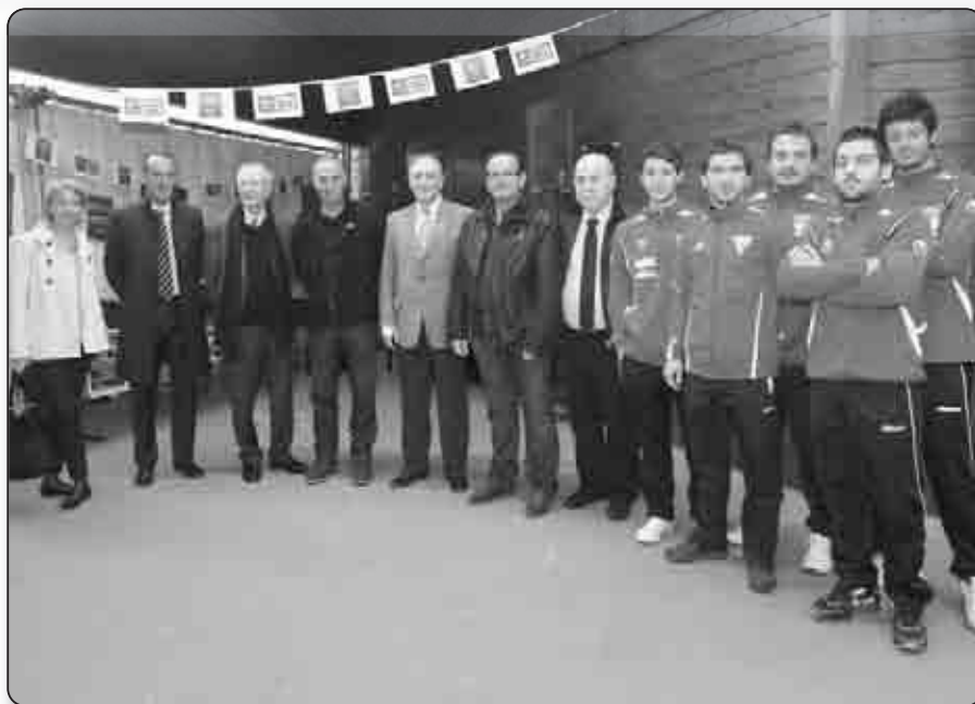
Les officiels réunis pour la remise des prix